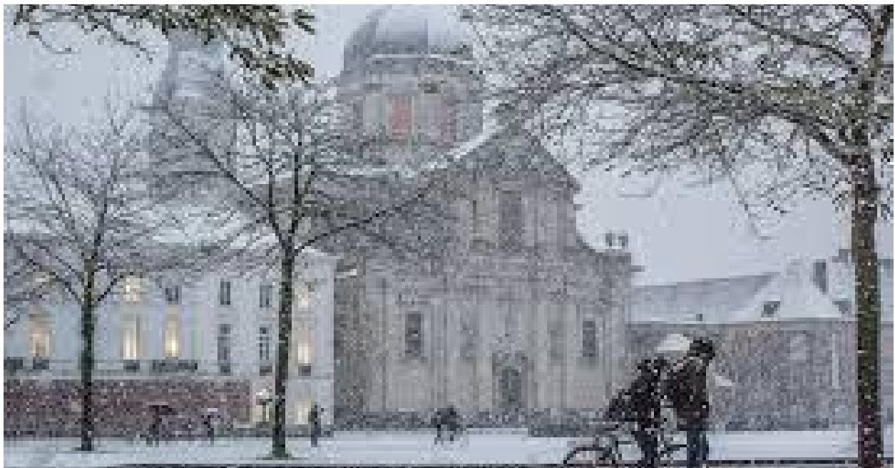
Coole kerk hé

Wat ik je wel al kan vertellen is dat we zeker worden verwacht in perfect uniform en dat we achteraf samen iets eten op het lokaal!